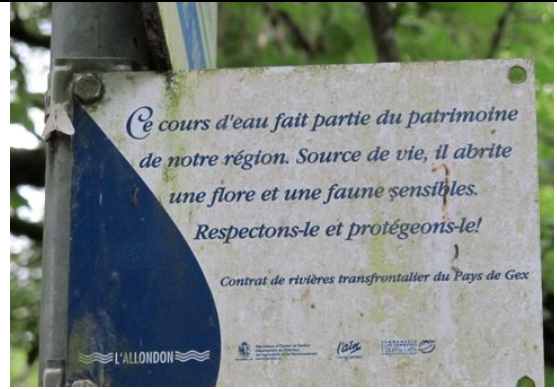
Petit rappel salutaire