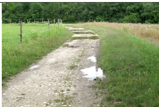
Plutôt délicat par temps de pluie