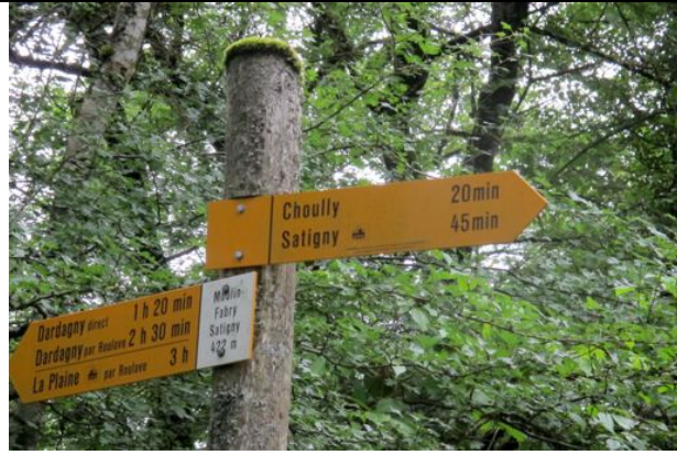
Thoiry , Val Thoiry, Saint Genis ?