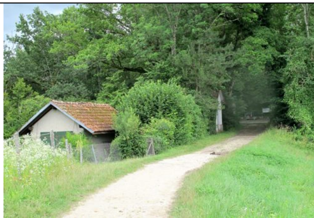
En vue du pont sur l'Allondon