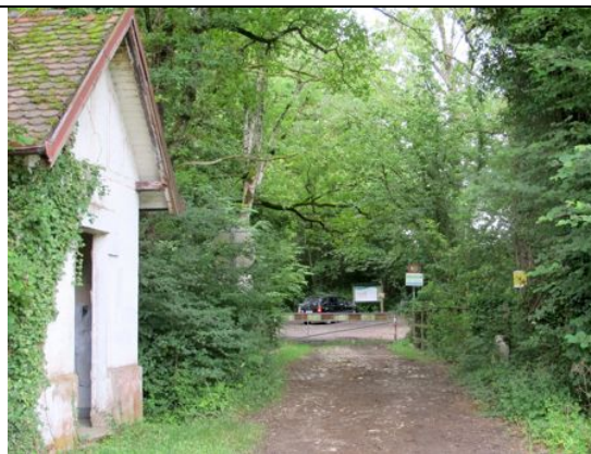
La hutte des douaniers