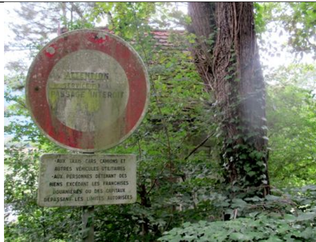
Cela ne nous rappelle rien ?