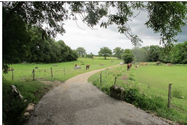
Fin de la partie goudronnée